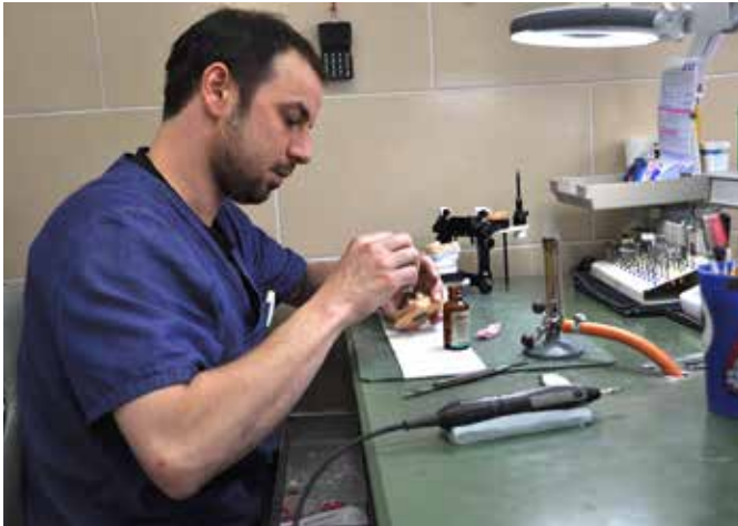
► ZT Hermanns beim Auftragen eines Trennmittels auf Alginatbasis