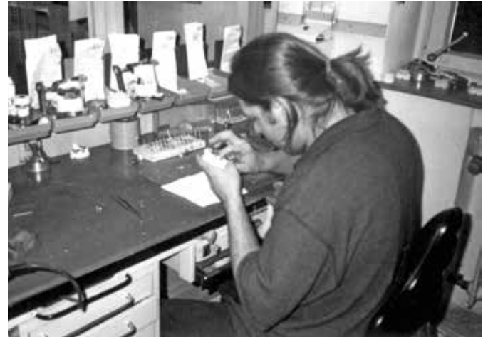
► Ein klassischer Techniker-Arbeitsplatz Anfang der 1980er Jahre – mit sichtbar guter Auftragslage