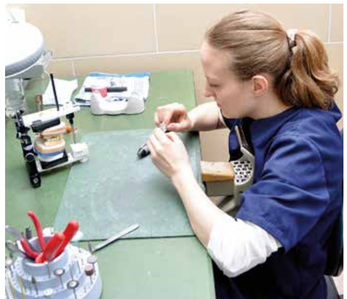
► ... und eine Technikerin in den heutigen Arbeitsräumen

schwierigen Zeit allerdings nach neuen Strukturen verlangt.