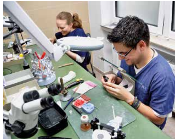
► So sieht es heute im Technikraum aus – die Lupenbrille ist stets griffbereit

► Klassische Meisterarbeit aus den 1980er Jahren, entstanden im Labor Aniol: dreigliedrige kunststoffverblendete Edelmetallbrücke (23-25) im Oberkiefer, davor eine verblendete Edelmetallkrone (22) und im Unterkiefer eine Klammerprothese. Heute würde man das Brückengerüst wahrscheinlich aus Zirkonoxid fertigen, die Krone aus Lithiumdisilikat oder zirkonoxidverstärktem Lithiumsilikat und für den Unterkiefer eine implantologische Behandlung anstreben